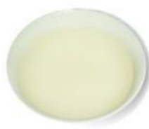
粥湯/肉湯/魚湯 /蛋花湯(只可以喝湯)