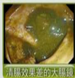
清腸效果差的大腸鏡