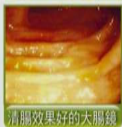
清腸效果好的大腸鏡